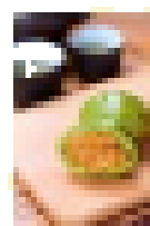
品牌 咸蛋黄肉松青团