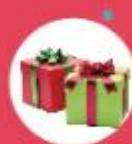
更多好礼请以 询问处海报为准