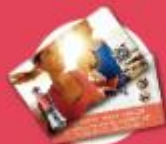
伊莱克斯 滚筒机只奖券