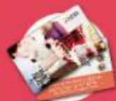
伊莱克斯 球水套只奖券